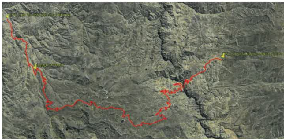
ILUSTRACIÓN N°2 UBICACIÓN DEL TRAMO DEL PROYECTO A INTERVENIR