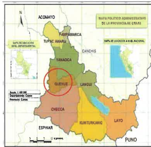
ILUSTRACIÓN N°1 UBICACIÓN DE LA ZONA DEL PROYECTO DE INTERVENCIÓN