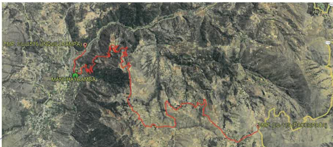
ILUSTRACIÓN N°2 UBICACIÓN DEL TRAMO DEL PROYECTO A INTERVENIR