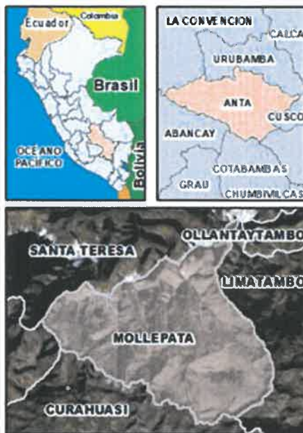
ILUSTRACIÓN N°1 UBICACIÓN DE LA ZONA DEL PROYECTO DE INTERVENCIÓN