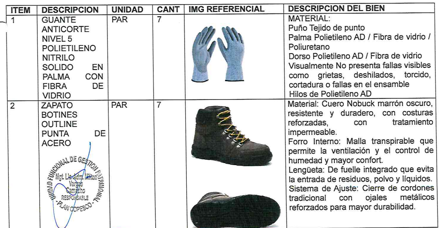
Tabla 1: Indumentaria de seguridad

El equipo/material/bien será entregado de acuerdo con las cantidades y descripción del siguiente cuadro: